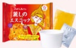
麗しのエスニック (薫るトムヤム)