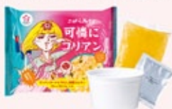
可憐にコリアン (牛だし韓国コムタン)