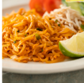
こばらみちる ピリ辛担々

スパイシーさがフレッシュなサラダと絶妙にマッチして、いつものサラダが劇的変化！液を切って好みの野菜と一緒に和えるだけ！サラダ以外に炒めたり、スープヌードルにしたりアレンジも自由自在！