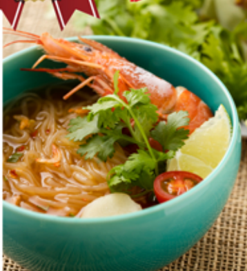
こばらみちる 麗しのエスニック(薫るトムヤム)

爽やかな香りと酸味に唐辛子の絶妙なアクセントが効いてスープまで飲み干したくなるクセになる美味しさ！ 「水・お湯不要！」レンジ2分でできるカップこんにゃく麺！