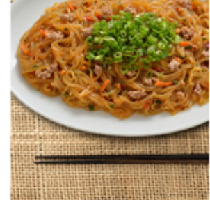
うまいのなんの！こんにゃくの ピリ辛みそ炒め(麻婆風)

大人から子供まで大人気の麻婆味！ ご飯がススム！下味付きのこんにゃく麺に具入り粉末タレをかけて炒めるだけ！お好みで野菜や肉と一緒に炒めたり気分に合わせてアレンジ調理も楽しめる！